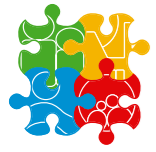
Katholiek Basisonderwijs Hengelo-Zuid